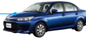
トヨタ コローラ TOYOTA COROLLA

大幅な効率向上・軽量化の実現により、車両燃費の向上に貢献し、日欧米の車種に幅広く採用されています。