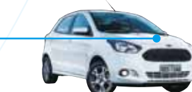
フォードカー Ford Ka

ロータリーバルブ構造を採用した小型化・効率向上により、新興国の小中型車ニーズに対応した省燃費性を実現しています。