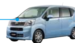
ダイハツムーブ DAIHATSU MOVE

小型車に適した優れた省燃費性能を維持しつつ、部品点数削減と機能部品高精度化により、軽量化と静粛性向上を実現しました。