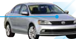
フォルクスワーゲン JETTA HV Volkswagen JETTA HV