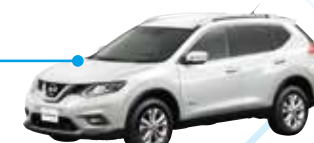
日産 エクストレイル HV NISSAN X-TRAIL HV