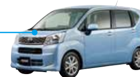
ダイハツムーブ DAIHATSU MOVE