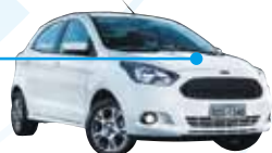
フォードカー Ford Ka