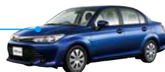
トヨタ コローラ TOYOTA COROLLA