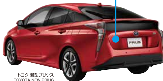
トヨタ 新型プリウス TOYOTA NEW PRIUS